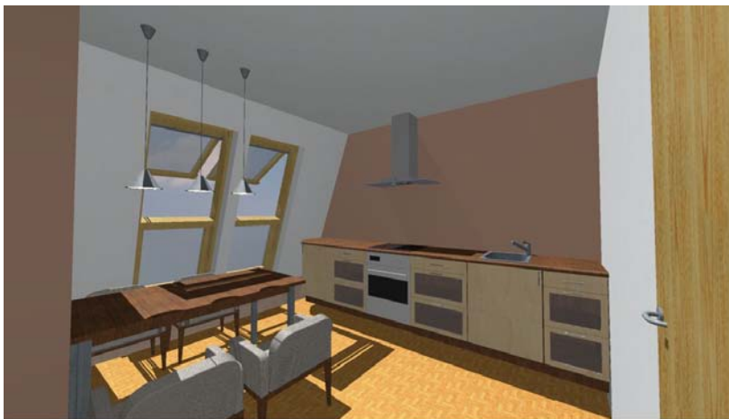
Beispiel 3D Ansicht der Küche im Dachgeschoss Neubau